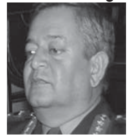
राजनीतिक विवादमा मुछ्न खोज्नुले ठूलै बाध्य छन् । प्रधानमन्त्र्यायाधिश स्वयं पश्यन्त्रको गन्ध आउन थालेको छ । (बाँकी अन्तिम पेजमा)