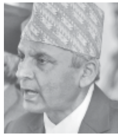
संविधानसभाले अनुमोदन गर्ने निर्णय गर्दै सेना परिचालन गर्न सिफारिस गरेपछि नेपाली सेना राजनीतिक बहसको विषय बन्न पुगेको

थापाको चेतावनीलाई सबै सञ्चार माध्यमले महत्व दिएका छन् भने राजनीतिक र कुटनीतिक वृत्तमा पनि चर्चा भइरहेको छ । खासगरी गत सोमबार खुलामञ्चमा असन्तुष्ट ३३ दलहरूले आमसभा गरे अनि भने- चुनावको बहिष्कार गरिने छ । बहिष्कार गर्दा दमन गरिए छापामार युद्धको घोषणा गर्छौं । कुनै पनि हालतमा देशलाई सिक्किमीकरण गर्ने चुनाव हुन दिँदैनौं । त्यसपछि सरकारले चुनाव सम्पन्न गराउन सेना परिचालन गर्ने निर्णयमा पुग्यो । (बाँकी अन्तिम पेजमा)