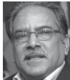
छ । सेना संविधान विपरीतको आदेश मान्न बाध्य छैन । प्रधानमन्त्र्यायाधिश स्वयं मन्त्रिपरिषद् अध्यक्ष रहेको स्थितिमा सेनालाई