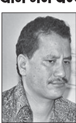
तयारीका सथा पार्टी अगाडि बढेको हुँदा त्यही रणनीति अनुसार अगाडि बढ्न आफ्ना कार्यकर्तालाई निर्देशन दिएका छन् । हामीसँग

काठमाडौं । नेकपा-माओवादीका सचिव नेत्रविक्रम चन्दले आफ्नो पार्टीसँग अर्भे पनि ठूलो मात्रामा हतियार रहेको हुनाले आफ्नो दललाई ३३ दलले राखेका मागहरू पूरा नगरी जबरजस्ती रूपमा संविधानसभाको दोस्रो निर्वाचन गराउन खोजेपछि आफ्ना कार्यकर्ताहरूले मतपेटिका खोस्ने योजना आफूहरूले बनाएको बताउँदै उनले संविधानसभा निर्वाचन बहिष्कार अभियान अन्तर्गत पहिलो खण्डमा सशस्त्र प्रतिकार गर्ने