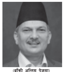
(बाँकी अन्तिम पेजमा)

छन् । हालै ताप्लेजुङको खोकलिङमा भएको शिनेट प्रहार कांग्रेस कार्यकर्ताले गरेको भन्दै नेकपा एमालेले विरोध जनाएको छ भने कांग्रेसले त्यसको प्रतिवाद समेत गरिसकेको छ । चुनावमा गएका दलहरू नै एक अर्काप्रति आरोप प्रत्यारोपमा उत्रिएका हुनाले आउँदो संविधानसभाको चुनाव स्वच्छ, स्वतन्त्र र निष्पक्ष नहुने प्रायः निश्चित जस्तै देखिएको छ । निर्वाचन आयोगले दलहरूको