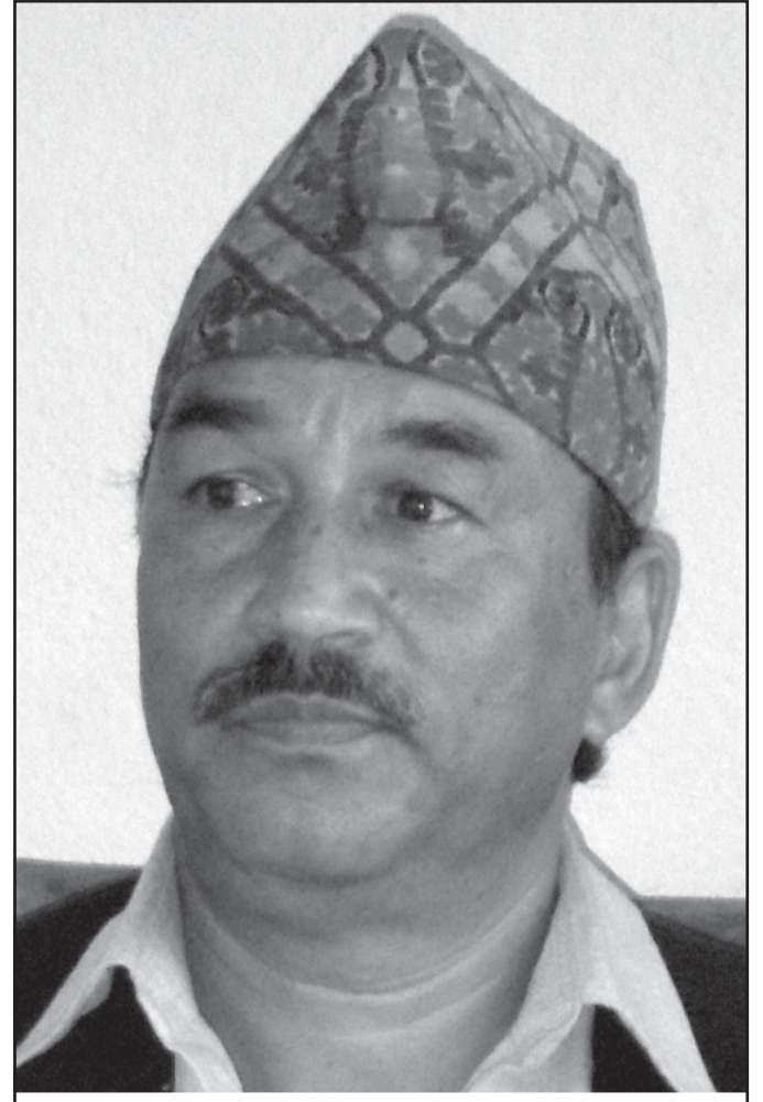
कमल थापा अध्यक्ष, राष्ट्रपति नेपाल

तेश्रो कुरा, हाम्रो जस्तो प्रजातन्त्र भर्खर बामे सन्ने अवस्थामा रहेको मुलुकमा जनता स्वयं सक्रिय भएर जनउत्तरदायी व्यवस्था कायम गर्न