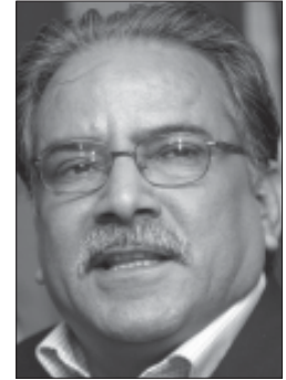
दाहालले शान्तिपूर्ण रूपमा चुनाव सम्पन्न भएको भन्दै चुनावमा भाग लिने सबैलाई (बाँकी अन्तिम पेजमा)