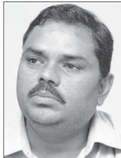
देखिएको एक मधेशवादी दलका नेताले बताएका छन् । गच्छदार र यादवलाई एकै (बाँकी अन्तिम पेजमा)

सबै मधेशवादी दलहरू एकीकरण हुनुपर्ने भन्दै केही मधेशवादी दलका दोस्रो तहका नेताहरूले औपचारिकता र