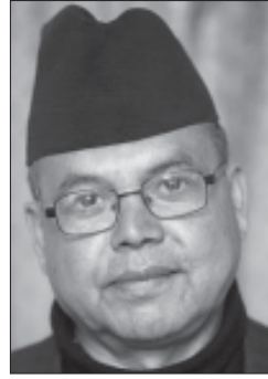
काम गरेको एमाओवादी अध्यक्ष पुष्पकमल दाहालले त्यसैबेला आरोप लगाएका थिए । मंसिर ४ गते राति नै अध्यक्ष पुष्पकमल