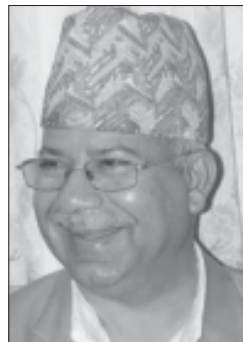
एमाओवादीले समेत संविधानसभाको चुनावमा जाँदा जनतासामु ६ महिनाभित्रमा स्थानीय निकायको चुनाव सम्पन्न गर्ने प्रतिवद्धता

काठमाडौं । पूर्वप्रधानमन्त्री एवम् नेकपा एमालेका वरिष्ठ नेता माधवकुमार नेपालले प्रधानमन्त्री सुशील कोइराला स्थानीय निकायको चुनाव गराउन खराएको गम्भीर आरोप लगाएका छन् । आफ्नै पार्टी सुशील कोइराला नेतृत्वको सरकारमा सहभागी भए पनि उनले चुनाव गराउन कोइराला मात्र खराएको आरोप लगाउँदै आफू अहिले प्रधानमन्त्री भएको भए पहिला नै स्थानीय निकायको चुनावको मिति घोषणा गरिसक्ने उद्घोषसमेत गरेका छन् ।