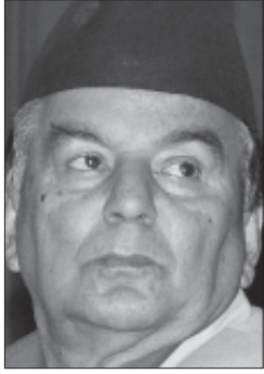
शासकीय स्वरूप, प्रणाली, शक्ति पृथकीकरण, संघीयता हुन् र यसको सहमति खोज्ने जिम्मा प्रचण्डलाई र प्रचण्डले सहमति