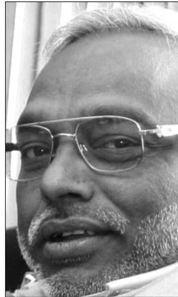
अन्तरसम्बन्ध एवं मधेस विषयक विचार गोष्ठीमा सहभागी भएका भारतीय राजनीतिक दलका नेता एवं बुद्धिजीविहरूले अधिकार

प्राप्तिका लागि मधेसमा जारी आन्दोलनको स्वरूप परिवर्तन गर्न आन्दोलनरत मधेसवादी दलहरूलाई आग्रह गरेका छन् । भारतको सत्तारूढ दल भारतीय जनता पार्टीका वरिष्ठ नेता एवं पूर्व केन्द्रीय मन्त्री डा.सञ्जय पासवानले विचार गोष्ठीमा बोल्दै नाकामा धर्ना दिएर सधैँभरी नाकाबन्दी गर्न ठीक नहुने तर्क गरेका थिए । नाकाबन्दीले आन्दोलन सफल नहुने भन्दै उक्त दलले आन्दोलनको स्वरूप परिवर्तन गर्न सुझाव समेत दिए । पासवानले भने अधिकार प्राप्तिका लागि मधेसवादी दलहरूले गरेको आन्दोलनमा भारतले निरन्तर सहयोग गरिरहने प्रतिबद्धता जनाउँदै मधेस आन्दोलनमा विगतमा पनि समर्थन थियो, आज पनि छ र भोली पनि रहिरहनेछ भन्दै सरकारसँग गरिने सहमतिका विषयमा मधेसवादी दलहरूले न्यूनतम साफा एजेन्डा बनाउनुपर्नेमा जोड दिए । नेपालको हिमाल, पहाड र तराईमा रहेका शोषित, पीडित र विभेदमा पारिएका जनताको पनि सहयोग (बाँकी अन्तिम पेजमा)