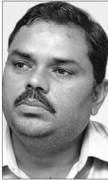
गरेका छन् । केही दिन पहिला बुद्ध जानकी सेन्टरले वीरगञ्जमा आयोजना गरेको नेपाल-भारत

हडताल गरेर मधेस आन्दोलन सफल नहुने बताएका छन् । उनीहरूले ६ महिनासम्म चलेको आन्दोलनले नेपालको राज्यसत्तालाई भन्दा मधेसी जनतालाई बढी पीडा दिएको भन्दै बन्द हडताल नगरी आन्दोलनको स्वरूप फेरि मधेसवादी दलका नेताहरूलाई आग्रह