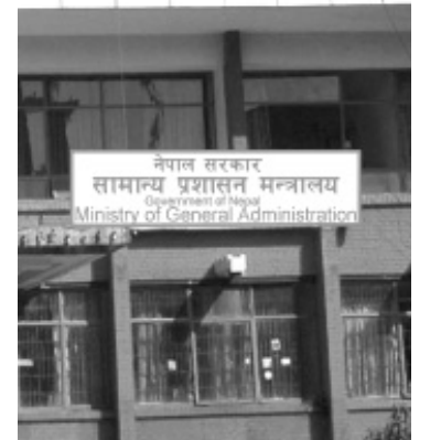
हुने पदमध्ये ४५ प्रतिशत पद छुट्टयाई सो प्रतिशतलाई शतप्रतिशत मानी महिलासहित विभिन्न वर्ग र समुदायबीच मात्रै प्रतिस्पर्धा (बाँकी अन्तिम पेजमा)

२०६४ सालदेखि महिलाका लागि ३३ प्रतिशत आरक्षणको व्यवस्था छ । अब त्यसको सट्टा खुला प्रतियोगिताद्वारा पूर्ति