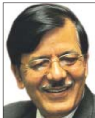
बढीको चन्दा दिने व्यक्तिहरूको नामसहित आयोगमा बुझाउनु पर्ने व्यवस्था गरेको छ ।

काठमाडौं । राजनीतिक दल र तिनका भातृ संगठनहरूले उठाउने गरेको चन्दा आतंकबाट उद्योगी व्यावसायिकहरू वाक्क भइ रहेका बेलामा निर्वाचन आयोगले राजनीतिक दलहरूको आम्दानी र खर्चमा पारदर्शिता र एकरूपता ल्याउनको लागि १७ बुँदे अनुसूचि तयार पारेको आयोग सुत्रले बताएको छ । यसअघि आफ्नै ढंगले आम्दानी र खर्चको विवरण बुझाउँदै आएका दलहरूले अब आयोगले निर्धारण गरेको १७ बुँदे अनुसूचि भरेर आयोगमा आम्दानी र खर्च बुझाउनु भएको पर्ने भएको छ । १७ बुँदे अनुसूचिमा दलहरूले पार्टीको सदस्यता र लेवीदेखि २५ हजारभन्दा