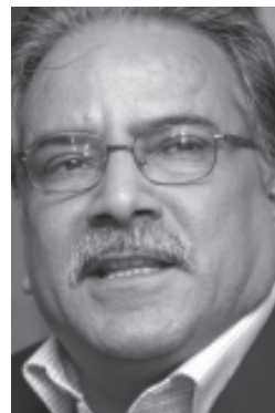
युनाव चाहँदैनन् भन्नेसम्मको आरोप पनि लागेको छ । तर मधेसी मोर्चालाई

साथ लिएर दुई तिहाई बहुमत जित्ने र 'कार्यकारी राष्ट्रपति' बनेर आफूले चाहेजस्तो संविधान बनाउने प्रचण्डको बाटो नेकपा-माओवादीले हिलाम्ने पारिदिएको छ ।