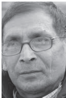
आम जनताको आँखामा छारो हाल्दै राजनीतिक भ्रमको खेती गर्ने प्रचण्डमाथि

'कार्यकारी राष्ट्रपति हुन्छु' भनेर हौंसिएका एमाओवादी अध्यक्ष प्रचण्ड सनक सन्किएका छन् । कहिले वैद्यजीले सहयोग गर्नुहुन्छ, कहिले एकता वार्ता भइरहेको छ - जस्ता टिप्पणी गरेर