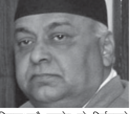
विमानस्थलमै उद्घोष गरे-निर्वाचनको लागि सुरक्षा मामीलामा निकै कठोर हुने निर्णय हुन सक्छ । चुनाव शान्तिपूर्ण स्वच्छ र स्वतन्त्र रूपमा सम्पन्न गर्न (बाँकी अन्तिम पेजमा)

अभियान संवाददाता काठमाडौं । निर्वाचन गराउने मुख्य जिम्मेवारी पाएको सर्वोच्च अदालतका वहालवाला प्रधानन्यायाधिश खिलराज रेग्मी नेतृत्वको सरकारले चार दलिय सिन्डिकेटको आदेशलाई स्वीकार गर्दै अन्य दलहरूलाई समेत निषेधको मार्ग अपनाउन सक्ने उद्घोष गर्न थालेपछि सडक संघर्षमा गएका दलहरू थप आक्रोशित भएका छन् । गत शनिवार जेनेभाको एक हप्ते भ्रमणबाट स्वदेश फर्किएका परराष्ट्र एवम् गृहमन्त्री माधव घिमिरेले त्रिभुवन