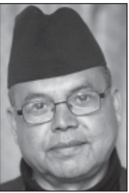
वाईसीएलको भागमा ३ करोड, सहिद (बाँकी अन्तिम पेजमा)