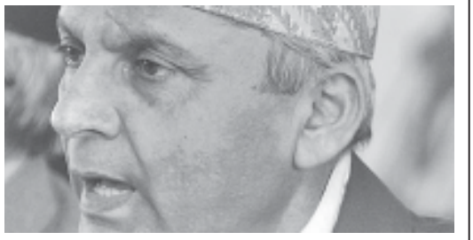
आफ्नो नौ घण्टे नेपाल भ्रमणमा आएका भारतीय विदेशमन्त्री खुर्सिदले नेपालको संविधान सभाको निर्वाचनको विकल्प नभएको भन्दै निर्वाचनको लागि भारत जस्तोसुकै सहयोग गर्न तयार रहेको बताउँदै तोकिएको समयमै निर्वाचन गर्न नेताहरूलाई विशेष निर्देशन दिएका थिए । निर्देशन लिन पुगेका नेताहरूले आ-आफ्नो पार्टीलाई सहयोग र समर्थन गरिदिन खुर्सिदलाई आग्रह समेत गरेका थिए । (बाँकी अन्तिम पेजमा)

काठमाडौं । भारतीय विदेश मन्त्री सलमान खुर्सिद नौ घण्टे औपचारिक नेपाल भ्रमणमा आएका बेला नेपालमा पूर्व प्रधानमन्त्री सहित पार्टीका बरिष्ठ नेताहरू खुर्सिदको अगाडी लम्पसार पनाले नेपाली जनताको शिर भुकेको छ । पूर्व प्रधानमन्त्री र पार्टीका नेताहरूले खुर्सिद बसेको होटलमै पुगेर आफ्नो मात्र होइन नेपाली जनताको शिर भुकाएका छन् । पूर्व प्रधानमन्त्रीहरूले खुर्सिदलाई आ-आफ्नो पार्टी कार्यालयमै बोलाएर भेटगर्नु पर्नेमा उनले दिएको समयमा लामबद्ध भएर भेटघाट गर्नुले प्रमाणीत गर्दछ नेपालका राजनैतिक दल र तिनका नेताहरू भारतप्रति कति भक्त रहेछन् ।