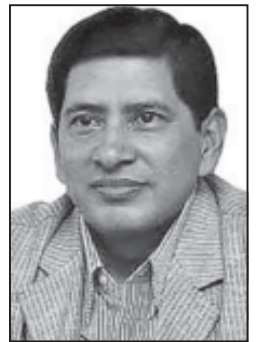
दाहालले चलेका छन् । यद्यपि एउटै व्यक्ति २४ वर्षदेखि एउटै (बाँकी अन्तिम पेजमा)