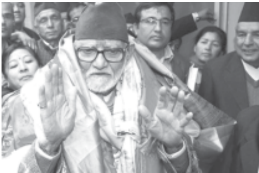
७ बुँदे सहमति गरेर स्वच्छ, सरल, सुशील सरकार भनेर रोड्मबाट 'समर्थन' गर्न एमालेले बल्लु दरवार नपुग्दै आलोचना गर्यो- सुशील धोकेबाज रहेछन् । यस्तो सरकार चल्न दिइनेँ । राप्रपा नेपालका अध्यक्ष कमल थापाले

थालनी भने- आशा गरे अब सहमतिको संविधान बन्छ । प्रधानमन्त्री सुशील कोइरालाले प्रतिवद्धता दोहोर्‍याए- एक वर्षभन्दा संविधान लेखिन्छ । तर गृह मन्त्रालय भगडाको विड बन्थो ।