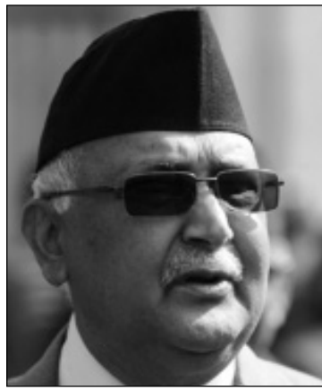
प्रधानमन्त्रीको अफर आउन थालेको छ । केपी ओलीको सरकार नगिरी मधेस

काठमाडौं । राष्ट्रपति विद्या भण्डारीप्रति सबैको सम्मान छ । उनलाई बलीको बोको बनाउन उनको मातृपार्टी एमाले र एमाले नेतृत्वको सरकार नै लागेको छ । कुरोलाई बंग्याएर पहाडी र मधेसीबीच द्वन्द्व गराउने कारण विद्या भण्डारीलाई अघि सारिदिए । यो अनुचित कार्यले मधेसी खेमा अरु बिचिकने खतरा बढेर गएको छ । कुरो हो, विद्या भण्डारीलाई अलच्छिना भन्ने को हुन् ? यो विश्वका महिलाहरूमाथिको अपमान हो । निश्चय महिलामाथि अपमान गर्न पाइन्छ । अपमान मधेसी मोर्चाका कार्यकर्ता र सरकारी कर्मचारीले नै गरेछन् । (बाँकी अन्तिम पेजमा)