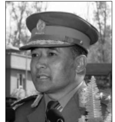
माछाहरूलाई मात्र कारबाही गरी ठूला माछाहरूलाई कारबाहीको दायरामा ल्याउन नसकेको आरोप लागिरहेँदा सशस्त्र प्रहरी (बाँकी अन्तिम पेजमा)

अख्तियार दुरुपयोग अनुसन्धान आयोगले वन्तका बारेमा परेका उजुरीहरूका बारेमा लामो समयदेखि छानविन गरिहेको थियो, तर, उनले विभिन्न शक्तिकेन्द्रहरूलाई खुसी पारेर कारबाही हुनबाट जोगिँदै आएका भएपनि अहिले उनी अख्तियारको फन्दामा परेका छन् । अख्तियारलाई साना