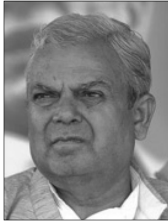
दलले अघि बढ्नु पर्ने बताएका छन् । मोर्चाका अनुसार ओली नेतृत्वको सरकार जतिबढी टिकछ त्यतिजेल आन्दोलनरत (बाँकी अन्तिम पेजमा)