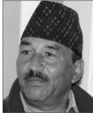
आन्दोलन साम्य नहुने भयो, भारतले नाकबन्दी पनि नखोल्ने भयो । हाहाकारमा नेपाल