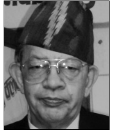
बाँसकवने स्थिति पनि रहेन । भूकम्पले ७ (बाँकी अन्तिम पेजमा)