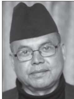
भएको कांग्रेस र तेस्रो ठूलो दल एमाओवादी मिल्दा पनि बहुमतीय सरकार निर्माण हुन (बाँकी अन्तिम पेजमा)