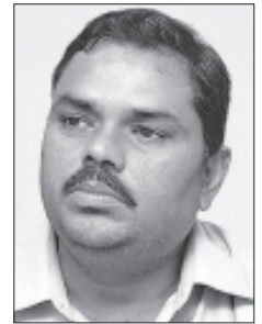
गयो भन्ने प्रष्ट पार्न भने सकेका छैनन् । मधेस पत्रकार संघले हाल काठमाडौंमा आयोजना गरेको दोस्रो (बाँकी अन्तिम पेजमा)

काठमाडौं । एमाओवादीले हाल सम्पन्न भएको संविधानसभाको दोस्रो निर्वाचनमा आफ्नो पार्टीको हारको कारण सेना परिचालन गर्नु नै थियो भन्ने निष्कर्ष निकाल्दै चुनावमा जितेका व्यक्तिहरूले प्रमाणपत्र पनि नलिने र समानुपातिक तर्फका व्यक्तिहरूको नाम पनि सिफरिस नगर्ने उद्घोष गरिरहेको बेला चुनावमा हारेका मधेसवादी दलहरूले पनि एमाओवादीकै मार्ग अपनाउँदै मधेस केन्द्रित केही दलहरूले संविधानसभा निर्वाचनमा राज्य संयन्त्र, सेना र विदेशी शक्तिले धौधली गरेको आरोप लगाएका छन् । उनीहरूले त्यस्तो आरोप लगाए पनि राज्य संयन्त्रले कस्तो धौधली गयो सेनाले कसरी धौधली गयो र कुन विदेशी शक्तिले कसरी र कस्तो खालको धौधली