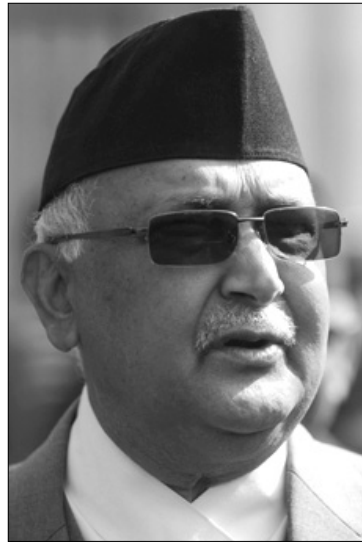
आन्दोलन हिंसात्मक भइरहन्छ भने सेना परिचालन हुनसक्ने विज्ञहरूले बताएका छन् ।

अवको वार्तामा सहमति हुन, नाका अवरुद्ध भइरहन्छ र मधेसी मोर्चाको