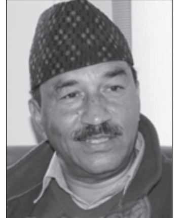
अचम्मित भएका छन् । यसअघि राप्रपा नेपालले पूर्वराजा महेन्द्र र नेपाल एकीकरणकर्ता (बाँकी अन्तिम पेजमा)

काठमाडौं । राप्रपा नेपालले नेपाली कांग्रेसका संस्थापक नेता विपी कोइरालाको आदर्शलाई स्वीकार गर्ने उद्घोष गरेको छ । राप्रपा नेपालका अध्यक्ष कमल थापाले विपी जन्मशताब्दीको अवसरमा हाल आयोजित एक कार्यक्रममा बोल्दै विपी पनि आफ्नो पार्टीको प्रेरणाको स्रोत भएको बताएका छन् । कांग्रेसकै कतिपय नेताले कांग्रेसले पछिल्लो समयमा विपीको आदर्शलाई भुलेको भन्दै आपत्ति जनाइरहेका बेला आफूलाई हिन्दू धर्मको रक्षक र कुनै न कुनै खालको राजतन्त्र नेपालमा आवश्यक छ भनेर वकालत गर्दै आएको राप्रपा नेपालले विपीलाई आदर्श मान्ने र आफ्नो पार्टीको प्रेरणाको स्रोत स्वीकार गर्नुले कांग्रेसीजनहरू