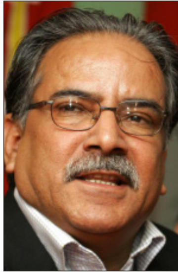
अन्यायपूर्ण काम गरे, चुप लागेर सहिष्णु भनेका छन् ।

साउन १८ र १९ गते भारतका प्रधानमन्त्री नरेन्द्र मोदी नेपाल भ्रमणमा आए । संसदमा संवोधन गरे । संवोधनका क्रममा शस्त्र, युद्ध होइन, बुद्ध भनेर प्रचण्डतिर इंगित गर्दै लोकतन्त्रको महिमा सुनाएका मोदीले हायात होटलमा भेट्दा प्रचण्डलाई भनिदिएका छन् । के चाहियो प्रचण्डले पत्रकार बोलाएर भनिहाले मोदीले मलाई सम्राट अशोकसँग दाँजिदिए । मोदीको नेपाल भ्रमणबाट कोही गद्गद छ भने प्रचण्ड छन् । तर प्रचण्डले मोदीको संकेत बुझे कि (बाँकी अन्तिम पेजमा)