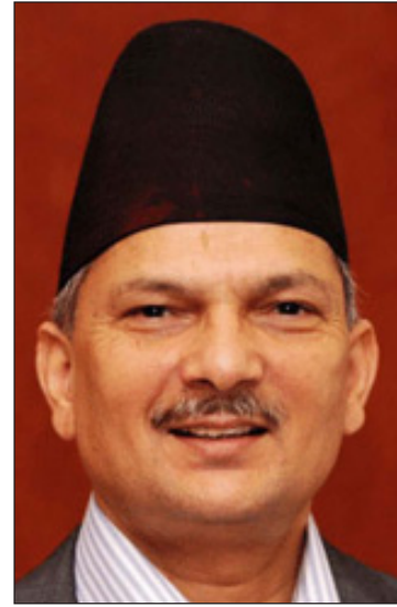
अर्थात् एमाओवादीभित्र भुसको आगो थियो, सल्केर दक्किन थालेको छ । यस्तै

विश्वासको संकेत पर्दा मोहन वैद्यले नेकपा-माओवादी पार्टी गठन गर्न पुगे । अब बाबुराम भट्टराईले नयाँ पार्टी बनाउने सम्भावना बढेर गएको छ ।