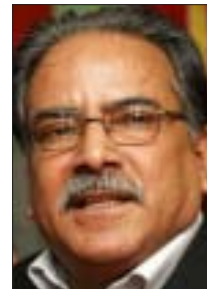
कुनै पनि गम्भीर अपराधमा समाधान दिन सकिन्न भनेर राष्ट्रसंघीय मानअधिकार